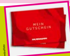
Gutschein von Kaufhaus Hubmann