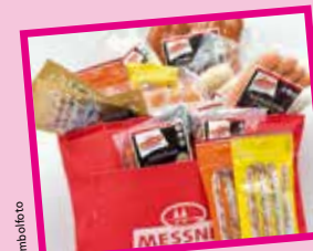
Kühltasche von Messner – die Wurstpioniere