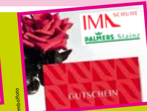
Einkaufsgutschein von IMA Schuhe & Palmers Stainz