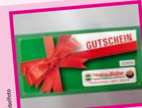
Einkaufsgutschein von Hagebau Wallner

Weitere Gutscheine liegen in den Geschäften auf.