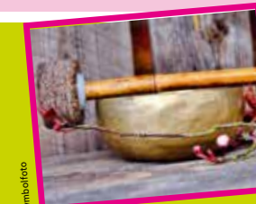
Klangschaleneinheit von Das Räumchen