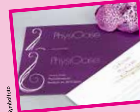
Gutschein von PhysiOase