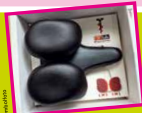
Gesundheitssattel von Bikefitting Hiebler