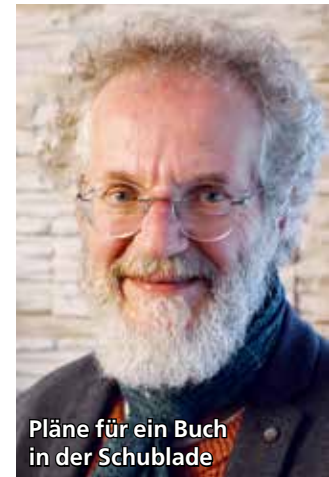
Pläne für ein Buch in der Schublade

Ebenso beim familiengerechten Arbeiten und dem Einbinden aller Altersgruppen (etwa Krabbelgottesdienste, Kinderkreise, Bibel-, Gesprächskreise und Religionsunterricht für Erwachsene) in den kirchlichen Ablauf. Besonders am Herzen lag ihm stets die Diakonie de La Tour in Deutschlandsberg für Menschen mit starker Beeinträchtigung. Soll auch nicht vergessen werden: Die Renovierung der beiden Kirchen in Deutschlandsberg und Stainz und die Neugestaltung des Pfarrhauses in Stainz.