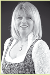
von Claudia Dunst- Mösenlechner