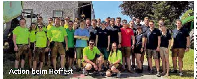
Action beim Hoffest

Darüber hinaus löste das neue Zuhause eine Vielzahl an Aktivitäten aus. So wurde der Landjugendball in der Festhalle Rassach als eines der gesellschaftlichen Highlights ins Leben gerufen. Überhaupt Geselligkeit: In der Landjugend wird familiäres Zusammenstehen (die LJ-Spätlese eingebunden) großgeschrieben. Das umfasst persönliche Anlässe ebenso wie das Ausrücken im Fasching, die Weihnachtsfeier, den Vereinsausflug, die Teilnahme an Sportveranstaltungen des Bezirksverbandes oder die Mithilfe bei Veranstaltungen anderer Vereine. In das pfarrliche Leben bringt sich der Verein bei der Segnung der Palmbüsche (das Acht-Meter-Gebinde ist beim Buschenschank Wuscht ausgestellt), dem Entflammen des Osterfeuers (danke an Grundbesit-