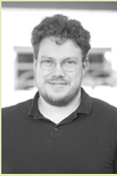
von Ferdinand Ruppert