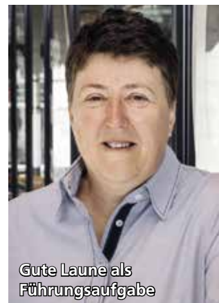
Gute Laune als Führungsaufgabe

che steirische Landesmeistertitel und Spitzenplätze bei internationalen Turnieren säumten ihren Weg nach oben. Dennoch: Studium und Beruf gingen vor, Ende der 1990-er-Jahre war Schluss mit dem Tennissport. Erst nach einer kreativen Pause griff sie in der Senioren-Bundesliga wieder zum Racket. So nebenbei führte sie das Damenteam des TK Bauxi Stainz in die Landesliga.