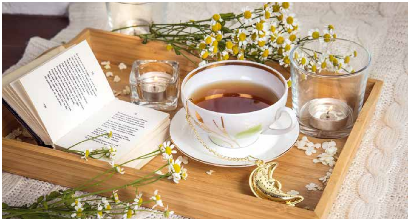
Anzeige, Foto: Apotheke Stainz

In vielen Fällen reicht eine Anpassung der Lebens- und Essgewohnheiten oder die Unterstützung durch rezeptfreie pflanzliche Arzneimittel aus der Apotheke, um die Beschwerden loszuwerden. Tritt innerhalb weniger Wochen keine Besserung ein, ist eine gründliche Untersuchung durch den Arzt notwendig.