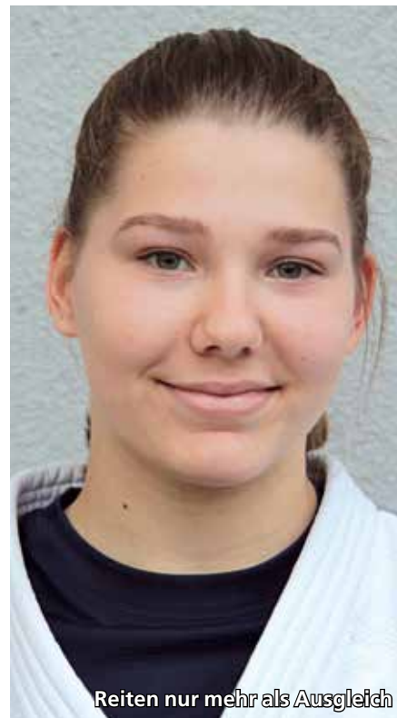
Reiten nur mehr als Ausgleich

und sich in den technischen Belangen (etwa Angriff und Konter) verbessern.