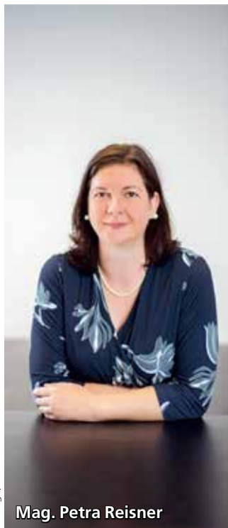
Anzeige, Foto: Tmkcsi

Der Herbst ist die ideale Zeit für Ihren Steuer-Check. Nutzen Sie unsere Tipps und erzielen Sie gemeinsam mit der Gruber.Reisner Steuerberatung ein optimales Jahresergebnis 2021.