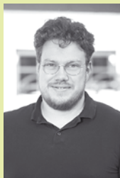
von Ferdinand Ruppert