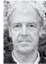
von Gerhard Langmann

Recht früh wurde begonnen, die Asylsuchenden auf ihre Fähigkeiten zu fokussieren. Das Nähen und der Verkauf von handgenähten Taschen war so ein Bereich, der die Menschen gleichermaßen beschäftigte und sie Geld für ihre eigenen Zwecke verdienen ließ. Bei vielen Anlässen waren die Taschen, Freundschafts-