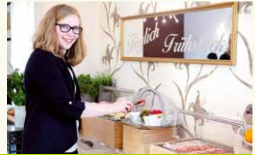
Gestartet haben wir bei der Bäckerei Freydl mit einem ausgezeichneten Sekfrühstück.