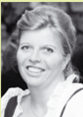
von Claudia Dunst- Mösenlechner