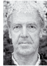
von Gerhard Langmann

Worin besteht die Aufgabe des Kommandanten? Kurz gesagt: Er führt die Kameraden bei Ausrückungen, Festlichkeiten oder kirchlichen Anlässen. Die Kommandos sind gleich wie jene im Bundesheer und bei der Feuerwehr. Der Hauptfeuerwehrmann der FF Grafendorf absolvierte einen Ausbildungskurs in der Grazer Gablenz-Kaserne. „Der Tag war sehr lehrreich“, wurden doch viele Situationen für die Einsätze beim Kameradschaftsbund durchgespielt. Selbst die