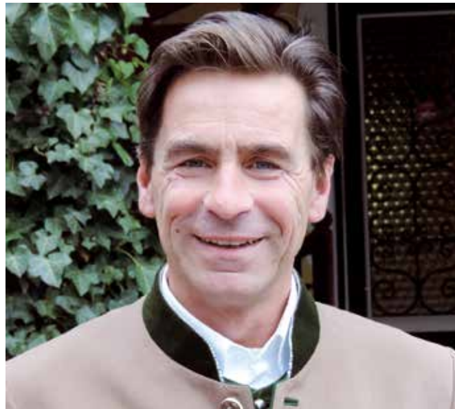
Franz Graf Meran

Er sprach schon damals von einer Zerstörung von Lebensräumen und Ökosystemen durch den Menschen, welchen dringend Einhalt zu gebieten wäre, um auch kommenden Generationen eine intakte Umwelt gewährleisten zu können. Da er auf der anderen Seite auch ein großer Mann der Förderung des technischen Fortschrittes war, war es ihm wohl auch bewusst und erfüllte ihn daher mit großer Sorge, dass die Menschheit eben diesen zu einseitig und ausschließlich für sich selbst zunutze machen würde, ohne dabei an die zweifellos auch