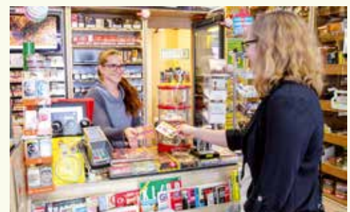
... für den Freund wandert eine Stange Salami vom Messner in die Einkaufstasche und für die Mama „Glückslose“ der Trafik Schauer ...