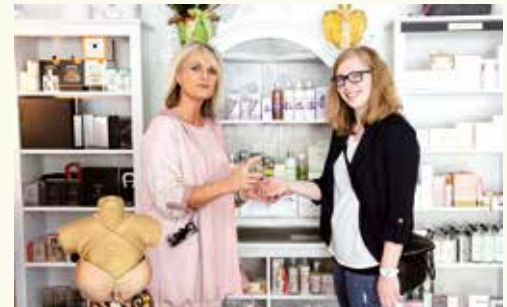
... weiter geht's: schlendern über den Hauptplatz, reingeschaut bei der Gärtnerei Hammer und schmökern bei Urig trifft Edel ...